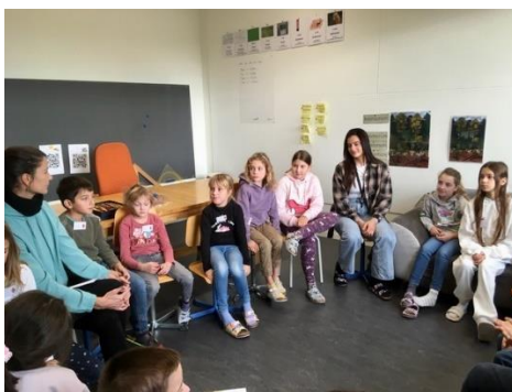
Geschichten hören und darüber austauschen