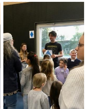
Gemeinsamer Start in der Turnhalle und Verteilen auf die Kunterbunt-Gruppen